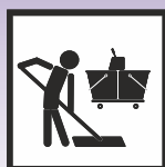
Manuelle Verarbeitung im Wischverfahren