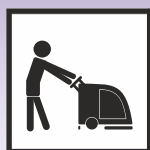
Maschinelle Verarbeitung mittels Automaten