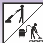
Maschinelle Verarbeitung bei der Grund- und Intensivreinigung